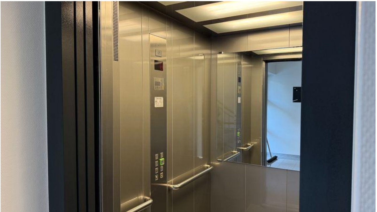
Aufzug zur Wohnung im 1.OG