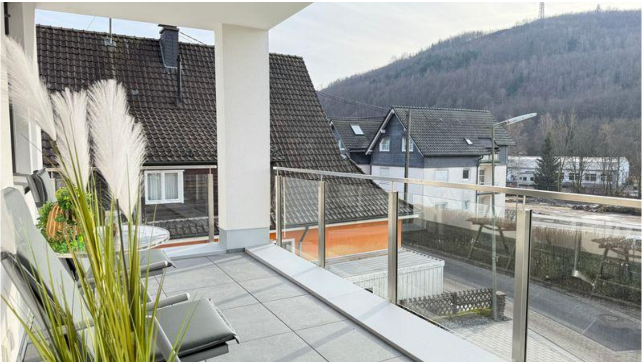
geräumiger Balkon mit Gartenstühlen