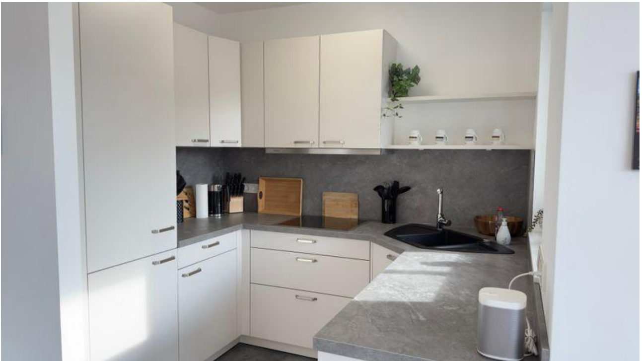
Küche mit Elektrogeräten