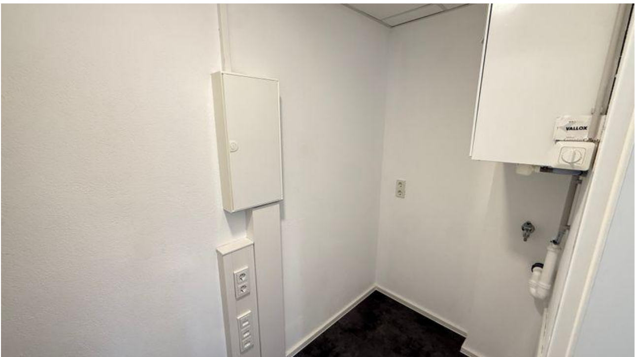
Abstellraum mit Waschmaschinenanschluss