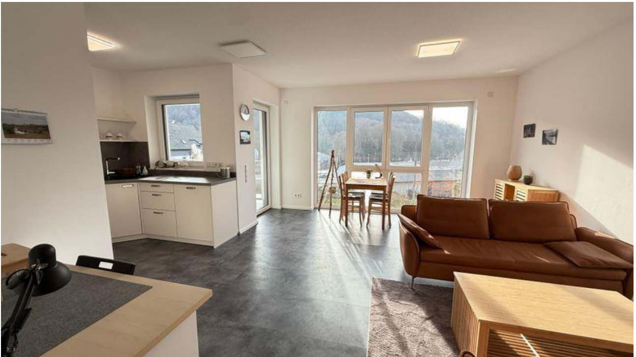
Moderne offene Wohnküche