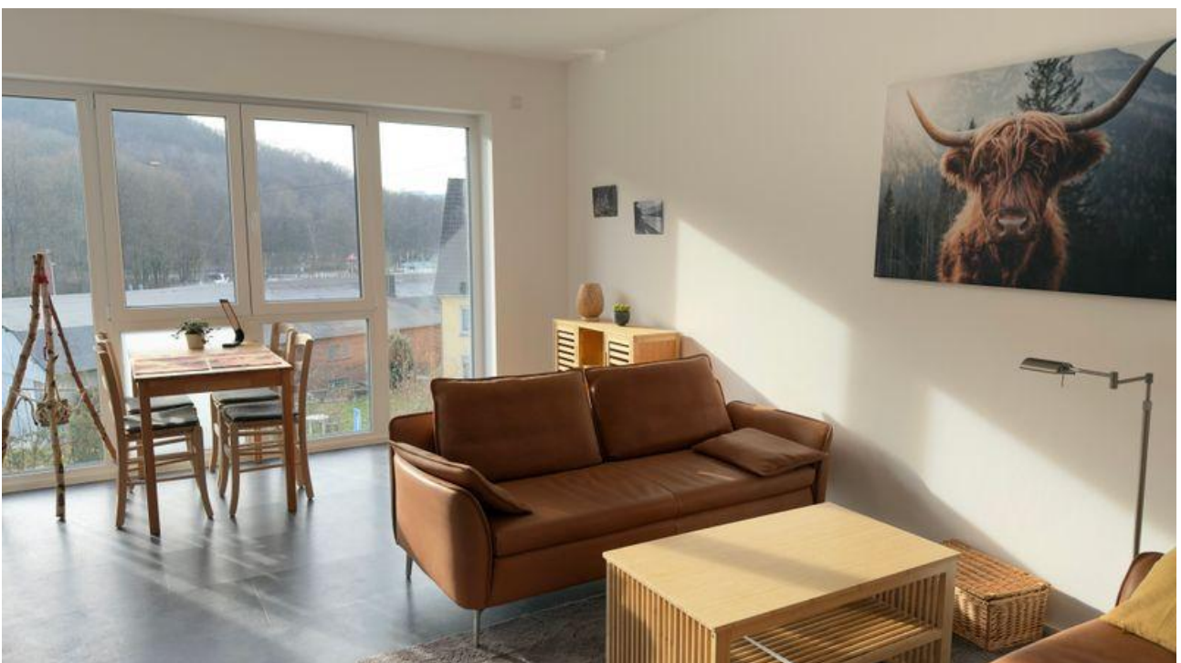
mit angrenzendem Wohnbereich